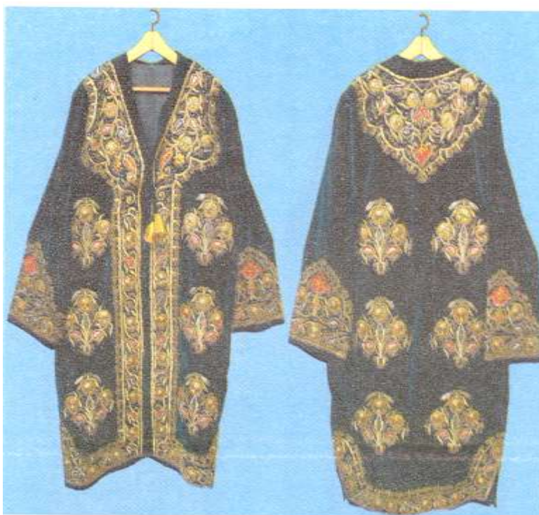
4-rasm. Duxoba. Zardo'ziy-guldo'ziy erkaklar choponi.

Guldo'zi usulining umumiy xususiyati shundaki, charm, korton, qalin qog'ozdan qirqilgan naqshlar, gullar ustiga turlicha xolatdagi zar iplar bilan butunlay qoplab tikiladi. Guldo'zi so'zi aralash so'z bo'lib, gul-gul, do'zi-forscha tikmoq degan ma'noni bildiradi.