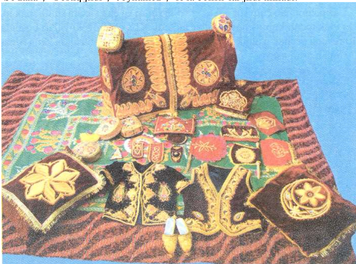
2-rasm. Zardo'zlik san'ati namunalari.

Erkaklar cho'ponlari chetdan keltirilgan baxmal birishim eng a'lo navli barhutlardan tikiladi. Baxmali farangi deb atalgan rus barhuti ham keng foydalanilgan. Bu gazlama g'arbiy Yevropadan Rossiya orqali keltirilgani uchun baxmali zagranish deb yuritilgan (ruscha zagranichniy so'zidan olingan). Barhutlar g'oyat rang-barang tusda bo'lishiga qaramasdan, kishilarga qizil, binafsha, yashil va ko'k rangdagilari ko'proq yoqqan. Qizil va binafsha rangdagi barhutlardan ayollar va bolalar kiyimlari uchun qo'llaniladi. Sof ipak barhutdan tashqari baxmali musi degan silliq, yarmi ipak barhut erkaklar choponidan boshqa barcha buyumlar uchun ishlatiladi. Yarim shoyi jaydari olacha gazlama zardo'zlikda deyarli barcha buyumlar tayyorlashda ishlatiladi. Undan asosan uy-ro'zg'or buyumlari (2-rasm) "So'zana", "Yostiq jildi", "Joynamoz", "lo'la bolish"lar jildi tikiladi.