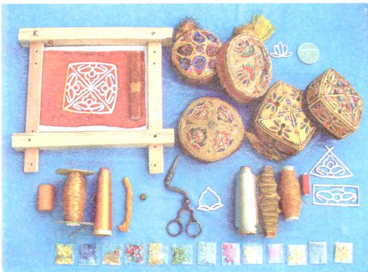
3-rasm. Zardo'zlikda do'ppi tikish uchun buyumlar

"Tilla" kalyobatun tayyorlash uchun sim ipga tilla suvi yugurtirilgan. Kalyobatunning asosini tashkil etuvchi ipak ipning rangi turlicha bo'lgan. Kolyobatun bilan sim Buxoro zardo'zligining asosiy xom-ashyosi hisoblangan. Ayniqsa, kolyobatun XIX asrning boshida shu paytgacha bo'lgan davrga oid barcha buyumlarda uchraydi. Zardo'zlikda oltin, kumush rangdagi ipak hamda sun'iy ipak va tolalardan foydalaniladi.