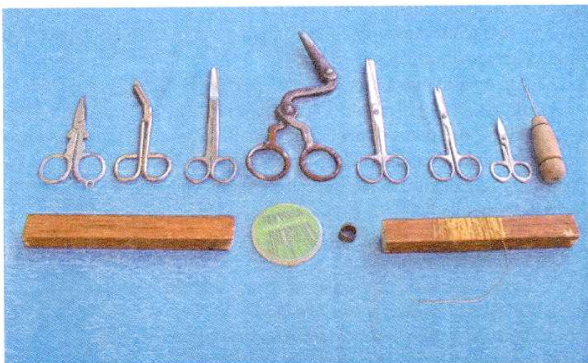
1-rasm. Zardo'zlikda ishlatiladigan asboblar.

3. Gullarni qirqishda ishlatiladigan shturgardon qaychi, ya'ni tuyabo'yin qaychi. Bu qaychi faqat gullarni qirqishda kerak bo'ladi. Naqshlarni qirqish uchun o'rdakburun qaychi ishlatiladi.