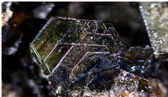
1-rasm. Biotit minerali[3]

Biotit – K(Mg,Fe)_3(OH,F)_2[AlSi_3O_{10}] . Biotit flogopit – KMg_3(OH,F)_2[AlSi_3O_{10}] va lepidomelan – KFe_3(OH)_2[AlSi_3O_{10}] dan iborat uzilmas izmorf qatorni oraliq a'zosi hisoblanadi. Mineral nomi fransuz fizigi J.Bio sharafiga Shunday nom bilan atalgan. Flogopitni nomi grek so'zi «flogopos» - o't, olov degan so'zdan olingan (bunda mineralni rangi ko'zda tutilgan). Lepidomelanni nomi grek so'zlari «lepis» - tangacha, «melyas» - qora so'zlaridan kelib chiqqan (qora rangli).